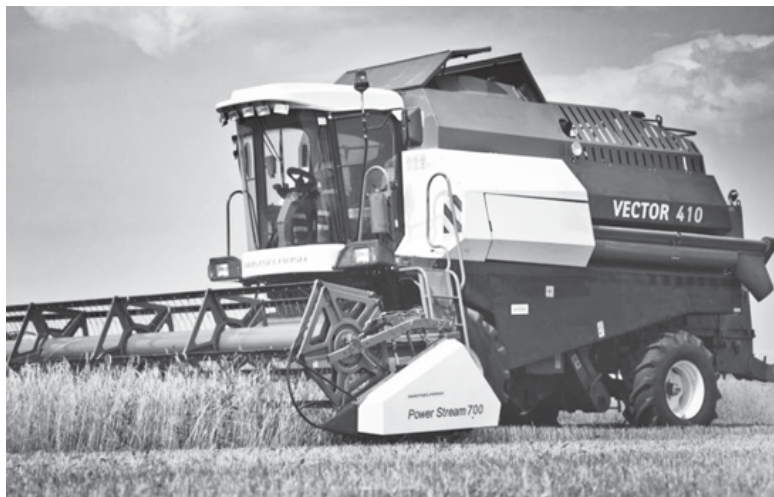
В поле - комбайн "Вектор-410".

(Подробнее с информацией об утвержденном перечне муниципальных маршрутов можно ознакомиться на сайте администрации Нолинского района nolinsk.rf ).